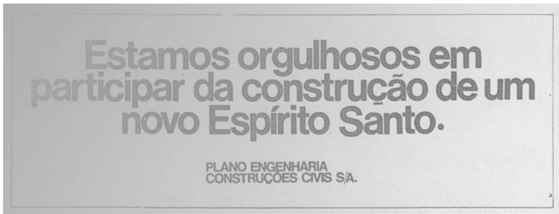
Rafael Pagatini (1985) Bem-vindo Presidente! (detalhe), 2015–2016 Impressão a jato de tinta sobre papel haini, 42 x 15 cm Acervo do artista, Vitória (ES)