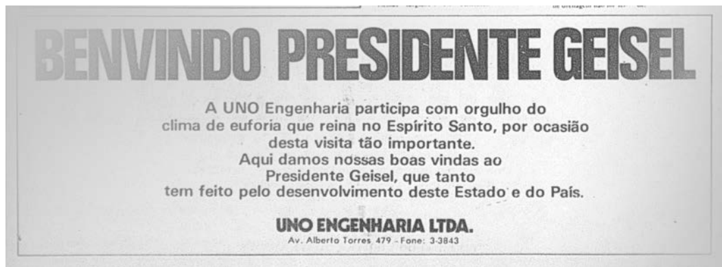
Rafael Pagatini (1985) Bem-vindo Presidente! (detalhe), 2015–2016 Impressão a jato de tinta sobre papel haini, 42 x 15 cm Acervo do artista, Vitória (ES)