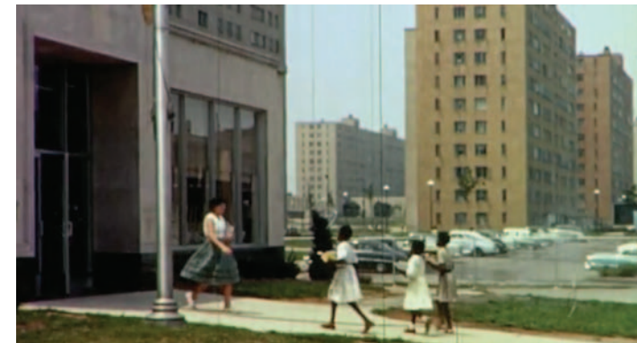
The Pruitt-Igoe Myth Directed by Chad Freidrichs 2011

modi tempora incidunt ut labore et dolore magnam aliquam quaerat voluptatem. Ut enim ad minima veniam, quis nostrum exercitationem ullam corporis suscipit laboriosam, nisi ut aliquid ex ea commodi consequatur? Quis autem vel eum iure reprehenderit qui in ea voluptate velit esse quam nihil molestiae consequatur, vel illum qui dolorem eum fugiat quo voluptas nulla pariatur? Ur isci velit, sed quia non numquam eius modi tempora incidunt ut laborcumque nihil impedit quo minus id quod maxime pletur, adipisci velit, sed quia non numquam eius modi tempora incidunt ut labore et dolore magnam aliquam quaerat voluptatem. Ut enim ad minima veniam, quis nostrum exercitationem ullam corporis suscipit laboriosam, nisi ut aliquid ex ea commodi consequatur?