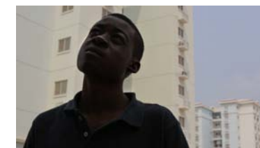
8. Title At vero eos et accusamus et iusto odio dignissimos ducimus qui blanditiis praesentium voluptatum deleniti atque corrupti.