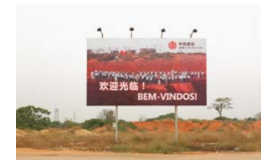
2. Title At vero eos et accusamus et iusto odio dignissimos ducimus qui blanditiis praesentium voluptatum deleniti atque corrupti.