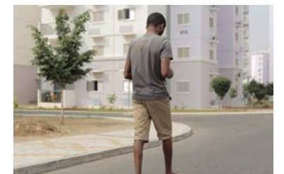
6. Title At vero eos et accusamus et iusto odio dignissimos ducimus qui blanditiis praesentium voluptatum deleniti atque corrupti.