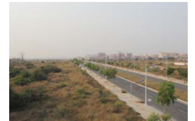
3. Title At vero eos et accusamus et iusto odio dignissimos ducimus qui blanditiis praesentium voluptatum deleniti atque corrupti.