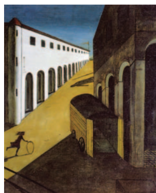
FROM TOP: Street scene, Luanda 1910