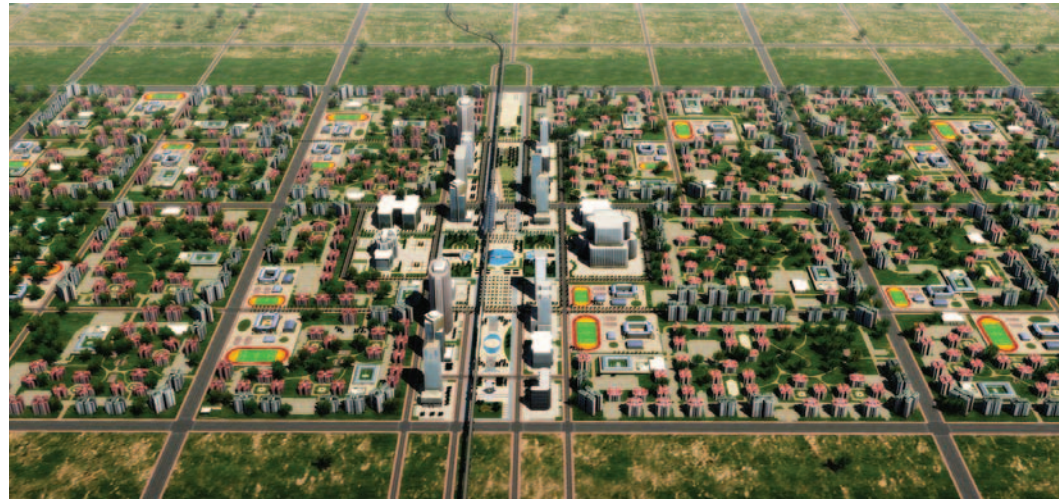
Digital overview rendering of the completed Kilamba Kiaksi New City. 2007