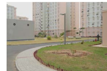
6. Title At vero eos et accusamus et iusto odio dignissimos ducimus qui blanditiis praesentium voluptatum deleniti atque corrupti.