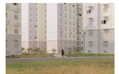
9. Title At vero eos et accusamus et iusto odio dignissimos ducimus qui blanditiis praesentium voluptatum deleniti atque corrupti.