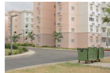
4. Title At vero eos et accusamus et iusto odio dignissimos ducimus qui blanditiis praesentium voluptatum deleniti atque corrupti.