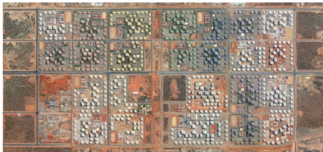
Aerial view of Kilamba Kiaksi New City under construction. 2010

quos dolores et quas molestias excepturi sint occaecati cupiditate non provident, similique sunt in culpa qui officia deserunt mollitia animi, id est laborum et dolorum fuga.