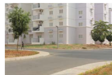
7. Title At vero eos et accusamus et iusto odio dignissimos ducimus qui blanditiis praesentium voluptatum deleniti atque corrupti.