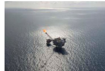
1. Title At vero eos et accusamus et iusto odio dignissimos ducimus qui blanditiis praesentium voluptatum deleniti atque corrupti.