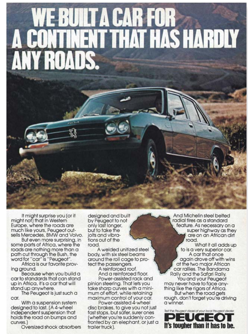
Peugot print advertisement 1979